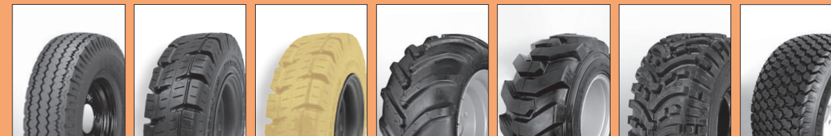
INDUSTRIAL FORKLIFT FORKLIFT ANTITRACCIA TRACTOR SKID ALL TRAC GARDEN